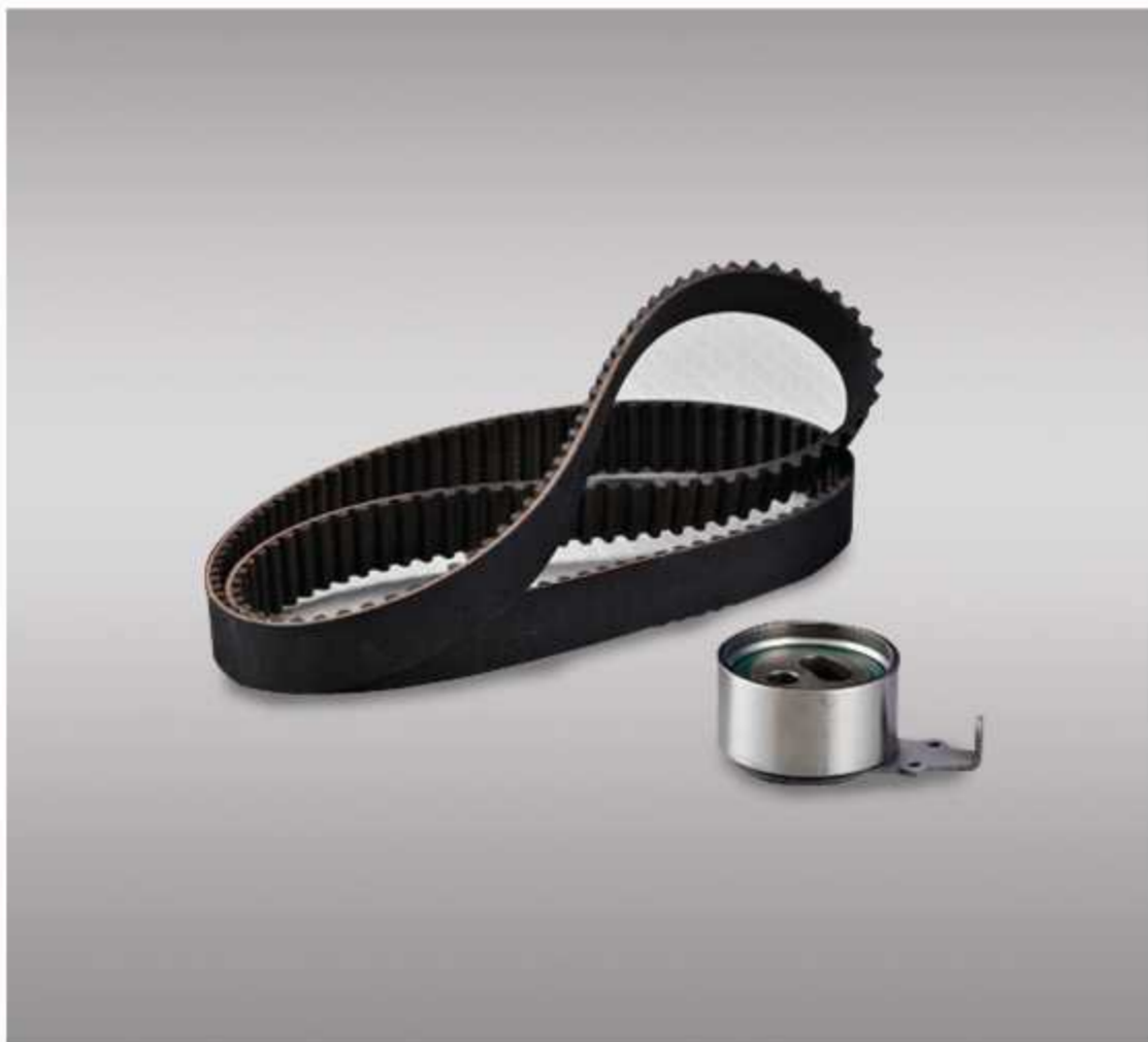
TIMING BELT KIT