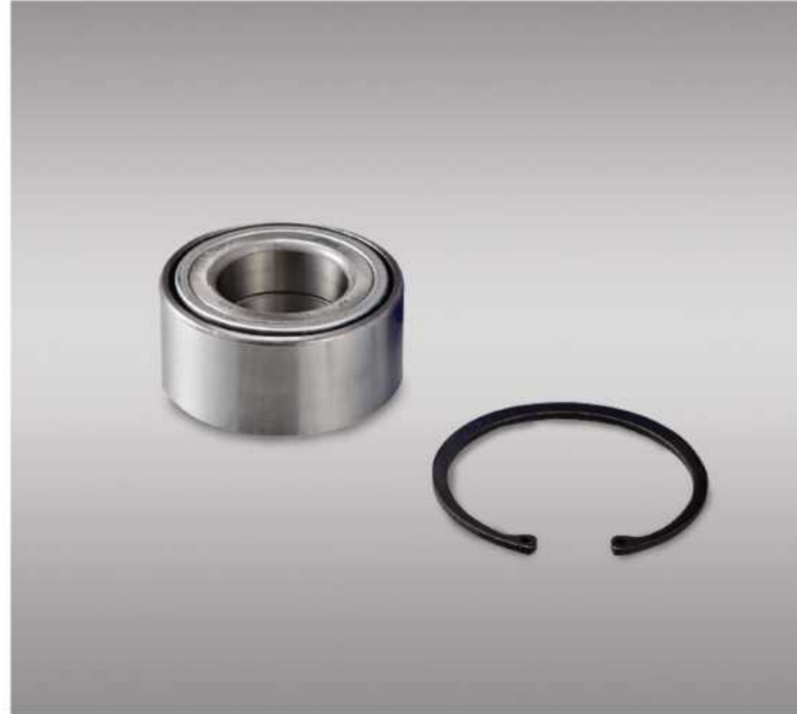
WHEEL BEARING KIT